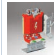
Sistemas de captación para 3er carril, aislamiento propio, con cojinetes sin mantenimiento

Piezas de Schunk se encuentran en muchos trenes de alta velocidad a nivel mundial (ICE, AVE, TGV, ETR 500)