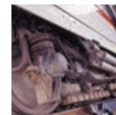
Progreso y seguridad: Contactos toma de tierra carbón-carbón