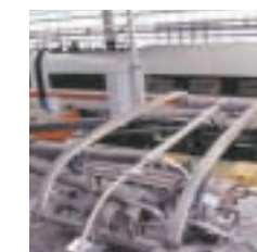
Frotador integrado con cuerno recubierto de carbón