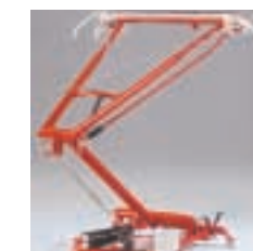
Pantógrafo con gran rigidez lateral, frotadores con suspensión independiente y amortiguación hidráulica en las tijeras