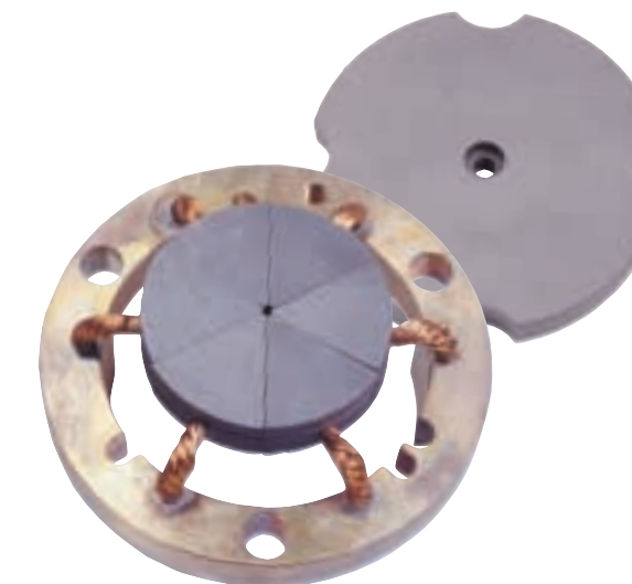
Contacto toma de tierra con segmentos de carbón

La experiencia adquirida en alta velocidad se aplica también a los pantógrafos de Cercanías y tranvías.