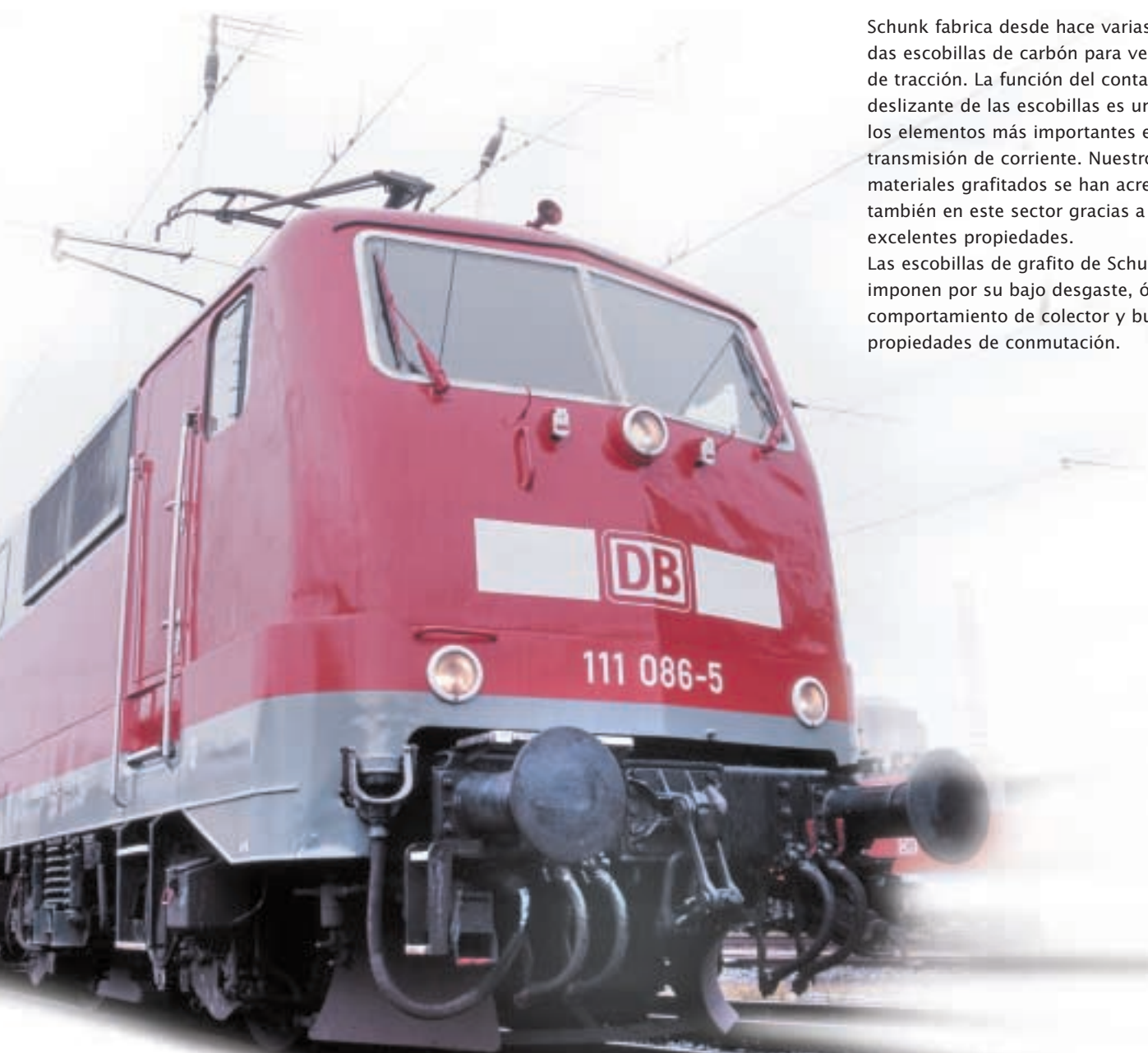
Una de las locomotoras más importantes del Deutsche Bundesbahn (BR 111). Con frotadores, escobillas de motor de tracción, portaescobillas y contactos toma de tierra de Schunk

Escobillas gemelas sin montaje ni cables, para moto- res de tracción de largo recorrido