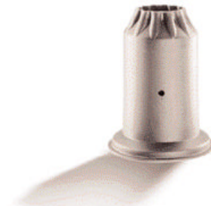
Máximo Rendimiento Quemador para calentamiento directo de gran eficacia en geometrías complejas