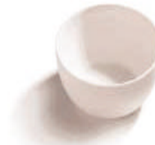
Excelentes Propiedades Cerámica: materiales con alto grado de pureza, resistencia química y térmica