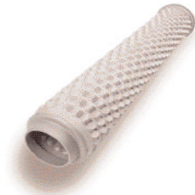
Un Líder en Cerámica Entre los líderes mundiales de tubos de llama por combustión así como quemadores recuperadores de SISIC