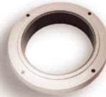
El Desafío de la Tribología Los materiales cerámicos "duros" proporcionan una larga vida útil, especialmente para aplicaciones en contacto con líquidos agresivos y abrasivos.