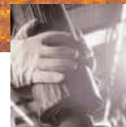
Desarrollo – Desde el prototipo hasta la fabricación en serie