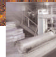
Control de Calidad – Un componente integral del proceso de fabricación